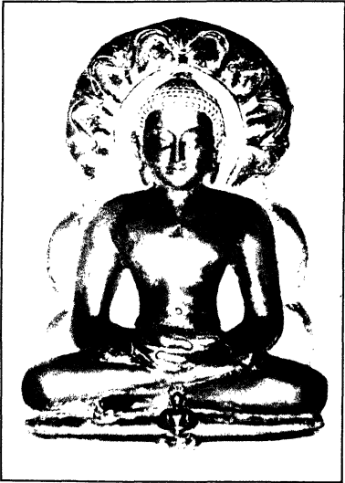
श्री अंतरिक्ष पार्श्वनाथ दिगम्बर जैन अतिशय क्षेत्र, गिरपुर (महा.)